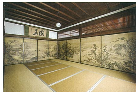
「国宝」襖絵全46点の一部